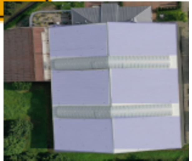
Squash & Tennishalle